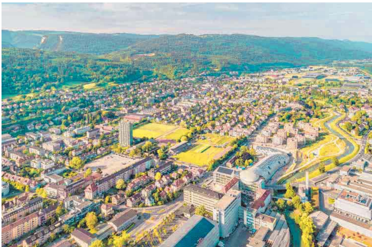
La continuité entre les différentes parties du futur quartier est au cœur des préoccupations des autorités.

Si la planification exacte des travaux reste relativement souple afin de «peaufiner au mieux le projet», les autorités ont déjà établi une ligne directrice. «Dans un quartier aussi central, la Ville se doit d'être exemplaire», a martelé la res-